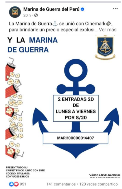
Facebook de la Marina de Guerra del Perú