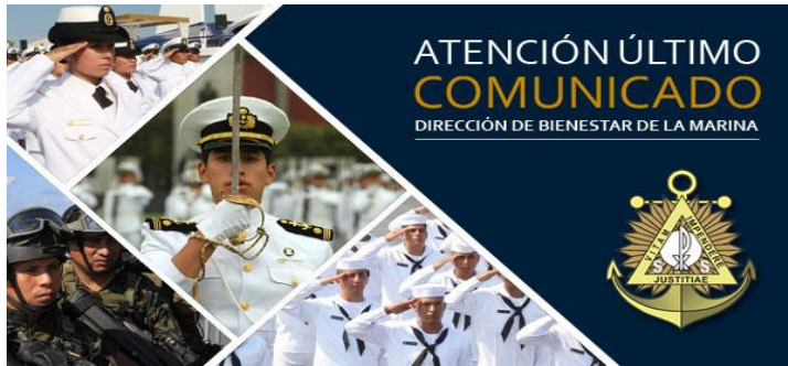
Página web de la Dirección de Bienestar de la Marina: www.dirbiemar.pe