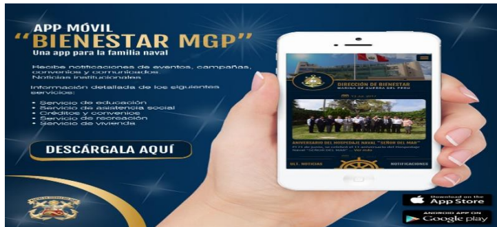
APP de la Dirección de Bienestar de la Marina