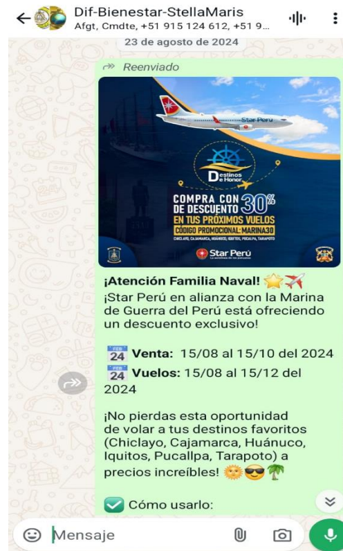
Canales de whatsapp